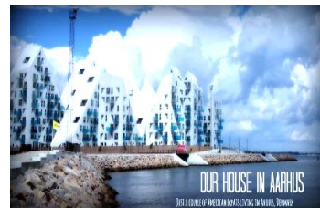
Aarhus ※Bing/Pixabay free picture より